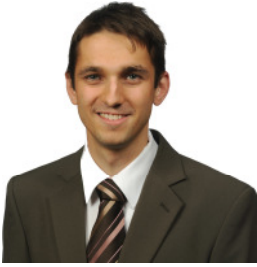
Timo Horst Listenplatz 8